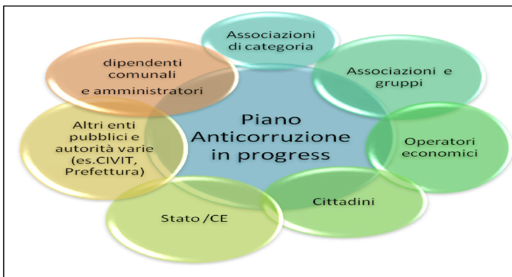
Figura 1 - Piano Anticorruzione Comunale e portatori di interessi